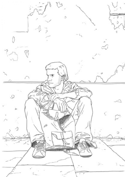
Sin título, en Punto de fuga, 2011, infografía sobre papel, 100 x 75 cm