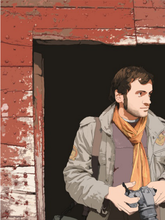
Mateo, en Punto de fuga , 2011, infografía sobre papel canvas, 141 x 108 cm