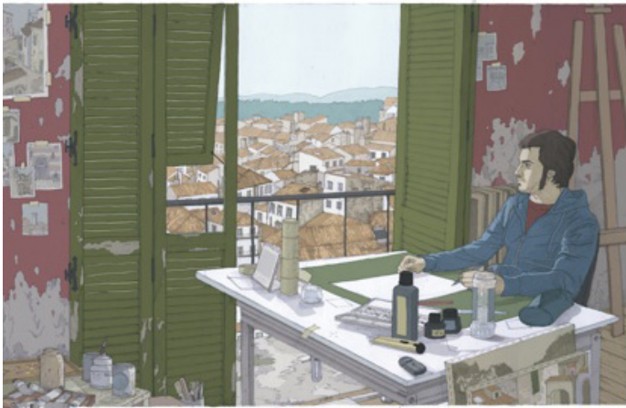
Sin título, en Punto de fuga, 2011, infografía sobre papel, 65 x 100 cm