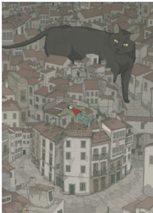
Sin título, en Punto de fuga, 2011, infografía sobre papel, 105 x 75 cm